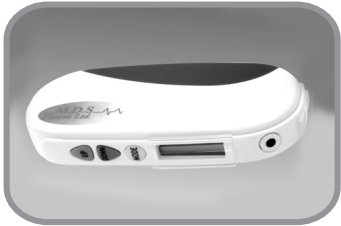
משכך כאבי צירים (טנס)