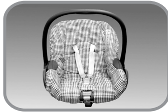
כסא בטיחות לרכב