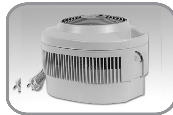
מכשיר אדים קרים