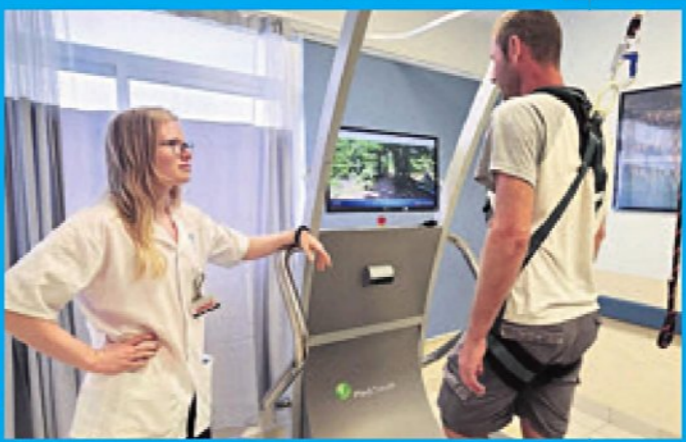
מנצבת Balance Tutor מדמה תפירות בזמן הליכה או ריצה, לצורך תרגול שיווי משקל