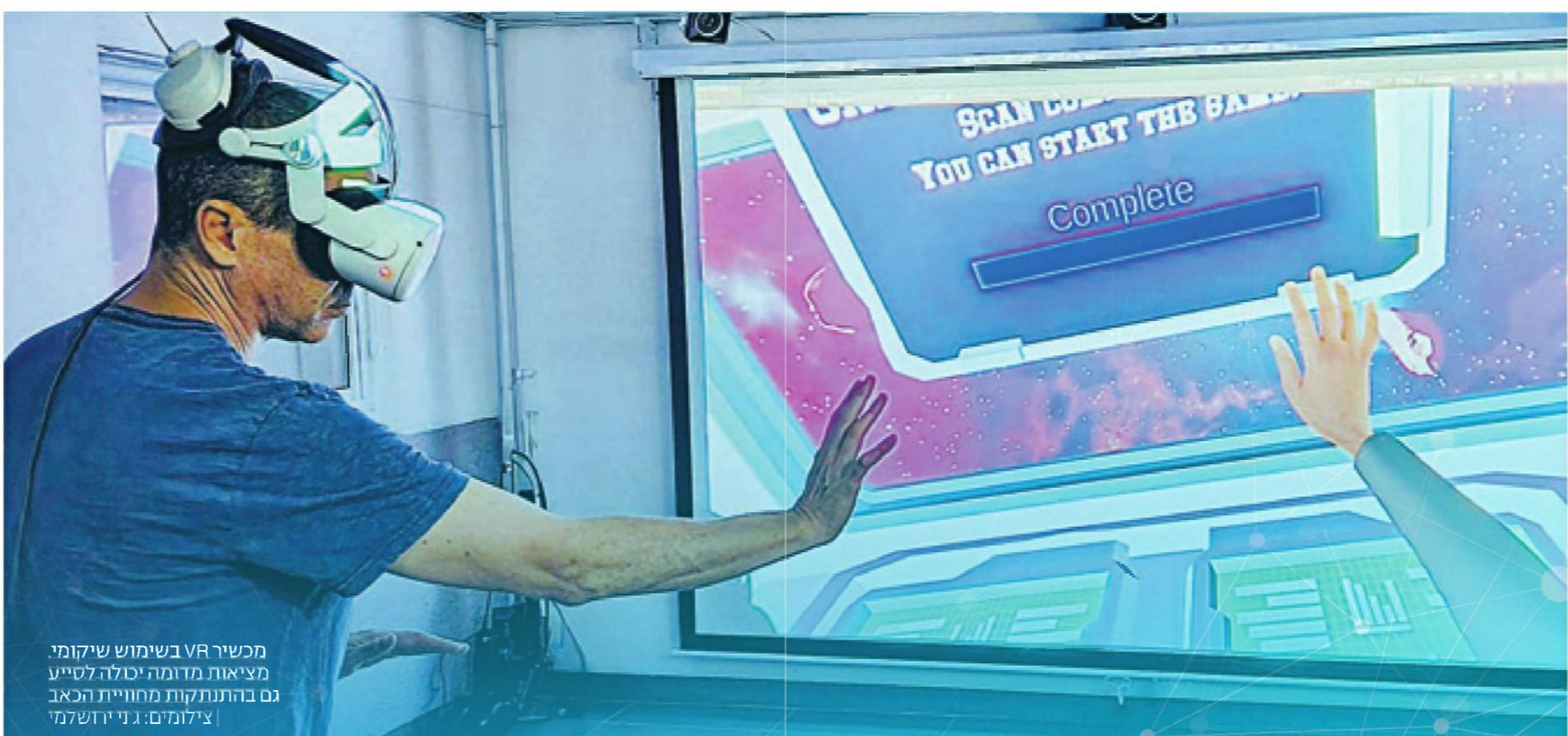
מכשיר VR בשימוש שיקומי מציאות מדומה יכול לסייע גם בהתנתקות מחוויית הכאב

לצורך פיתוחים עצמאיים, הוצרת בית, נעזר מערך השיקום באיכילוב במרכז לתפקודי המח-של בית החולים. במרכז לפעולות מנצבת ה"חולים" VR (המנצבת לטכנולוגיות "בית") בראשות ר"ח גל רן, שהוא גם - ולא